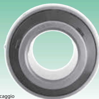
Suffisso UNF: Misure in pollici dei grani di bloccaggio UNF suffix: inch sizes set screws