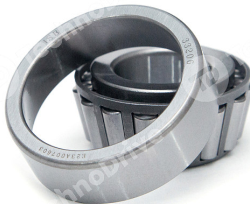
ОДНОРЯДНЫЕ КОНИЧЕСКИЕ РОЛИКОПОДШИПНИКИ (метрическая серия)

Внутренний диаметр [мм] – 25 Внешний диаметр D [мм] – 52 Ширина подшипника B i [мм] – 22 Уплотнение – Открытое Зазор – CN (нормальный зазор) Сепаратор – М (латунный, механически обработанный) Статическая нагрузка C 0 , Н – 54 Динамическая нагрузка C, Н – 46 Предельная скорость (жидкое масло), об/мин – 11700 Предельная скорость (консистентная смазка), об/мин – 9945 Класс точности – P6 Диапазон температур – от -40° до +120° Тип отверстия – Цилиндрическое Материал подшипника – Сталь Рядность подшипника – Однорядный T [мм] – 22 a [мм] – 18 Аналог FAG – Альтернативная маркировка подшипника FAG 33205 Аналог NSK – Альтернативная маркировка подшипника NSK HR33205 J Вес [кг] – 0,223