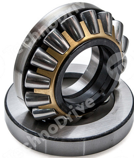
ОДНОРЯДНЫЕ КОНИЧЕСКИЕ РОЛИКОПОДШИПНИКИ (метрическая серия)

Внутренний диаметр [мм] – 100 Внешний диаметр D [мм] – 215 Ширина подшипника B i [мм] – 73 Уплотнение – Открытое Зазор – CN (нормальный зазор) Сепаратор – М (латунный, механически обработанный) Статическая нагрузка C 0 , Н – 764 Динамическая нагрузка C, Н – 560 Предельная скорость (жидкое масло), об/мин – 2700 Предельная скорость (консистентная смазка), об/мин – 2295 Класс точности – P6 Диапазон температур – от -40° до +120° Тип отверстия – Цилиндрическое Материал подшипника – Сталь Рядность подшипника – Однорядный T [мм] – 77.5 a [мм] – 73 Аналог FAG – Альтернативная маркировка подшипника FAG 32320-A Аналог NSK – Альтернативная маркировка подшипника NSK HR32320 J Вес [кг] – 13,006